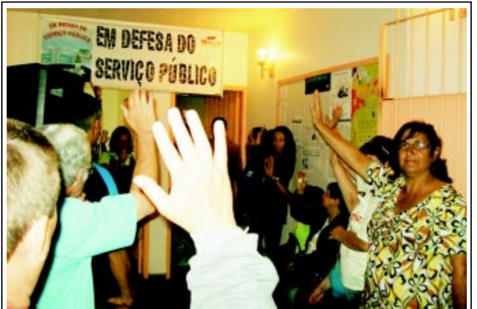
Funcionários na votação do dia 31 de março

Conquista no Santander Comparação de banana com Laranja?